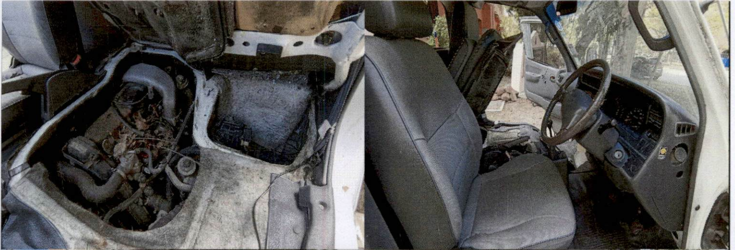
รูปรถยนต์ราชการ ทะเบียน นค-4554 ปทุมธานี (ภายใน)